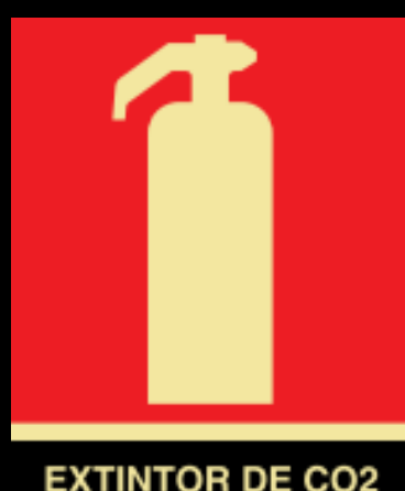
EXTINTOR DE CO2

EXTINTOR DE PÓ QUÍMICO SECO BC - age por abafamento, utilizados em princípios de incêndio da classe B, óleo, graxas, vernizes, tintas, gasolina e classe C, equipamentos elétricos energizados como motores, transformadores, quadros de distribuição, fios, etc.