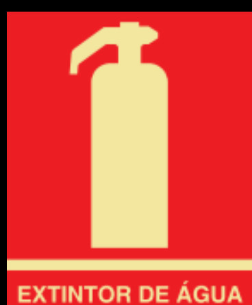
EXTINTOR DE ÁGUA

EXTINTOR DE ÁGUA - age por resfriamento, utilizados em princípios de incêndio da classe A, como tecidos, madeira, papel, fibras, etc.