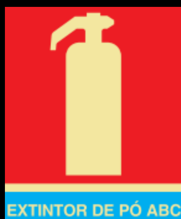
EXTINTOR DE PÓ ABC

EXTINTOR DE CO2 - age por resfriamento e abafamento, utilizados em princípios de incêndio da classe B, óleo, graxas, vernizes, tintas, gasolina, e classe C, equipamentos elétricos energizados como motores, transformadores, quadros de distribuição, fios, etc.