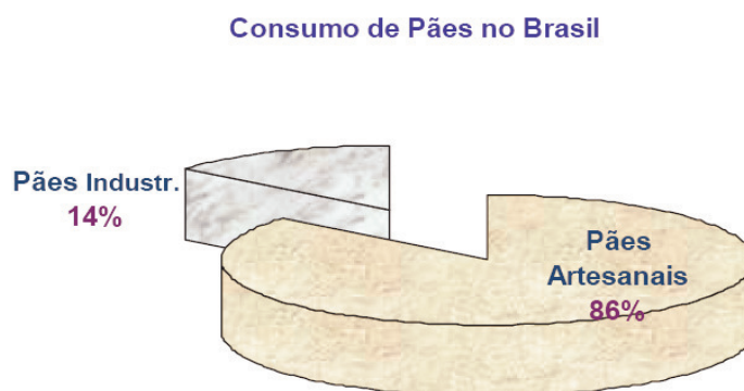
Figura 1 – Consumo de pães no Brasil

A Figura 1 mostra a distribuição de consumo no Brasil entre pães industrializados e artesanais evidenciando o amplo mercado de pão elaborados em empresas de menor porte.